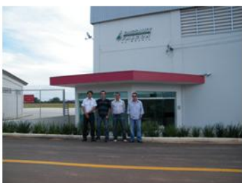
Juntando tudo, 140 anos de experiência

“Fotos da visita do Diretor da Eacon Santos, e instrutores.”