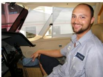
Ex aluno do curso Técnico de Manutenção de Aeronaves da Eacon Santos