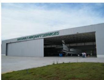
Hangar do Centro de Serviços