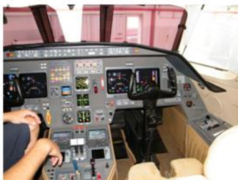
Cabine Glass Cockpit do Falcon 2000