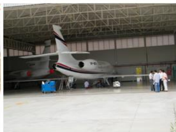
Reunião Técnica na porta do hangar - contos de causos!