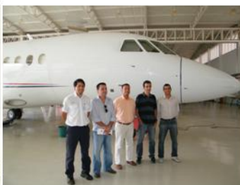
Cúpula a frente da aeronave em manutenção