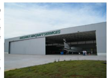
Hangar da Dassault de frente para pista de Sorocaba.

Há ainda a previsão de instalação de uma torre de controle completa em Sorocaba.